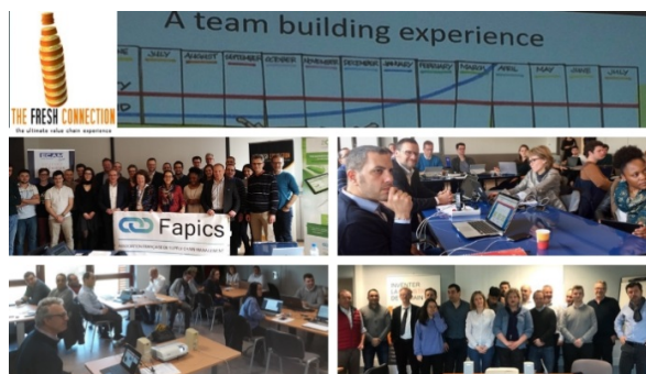
The Fresh Connection joué à Euralogistic, le Pôle d’Excellence Logistique et Supply Chain des Hauts de France et à l’ECAM Lyon avec le soutien du Pôle d’Intelligence Logistique Pil’s d’Auvergne-Rhône-Alpes.