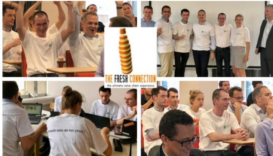
Finale Française du Challenge The Fresh Connection avec comme vainqueur ESSILOR le 07/07/2018

A l'issue de cette journée découverte, les entreprises peuvent ensuite proposer à leurs salarié-es de s'impliquer dans un challenge national qui démarrera en avril 2019. Pour mémoire, cette année, en 2018, une dizaine d'entreprises françaises ont participé au challenge professionnel parmi lesquelles de grandes entreprises comme ESSILOR, SANOFI, RENAULT, MICHELIN...C'est finalement ESSILOR qui a remporté en juin 2018 la finale nationale The Fresh Connection et qui a représenté la France à la finale mondiale qui s'est tenue à Milan le 28 septembre dernier. Au total plus de 300 équipes de plus de 60 pays jouent à ces Serious Games de Supply Chain Management, ce qui démontrent à fois un engouement pour ce type d'apprentissage et la volonté des entreprises de former et motiver leurs salariés autrement. Et ça marche. Preuve en est, la fidélité et le nombre croissant d'entreprises mais aussi d'universités-es qui chaque année invite leurs salarié-es et étudiant-es toujours plus nombreux à venir expérimenter ces serious games.