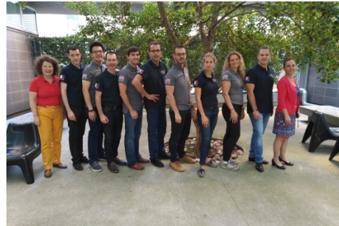
Global finale internationale à Milan avec deux équipes d'ESSILOR ESSILOR France et USA le 28/09/2018