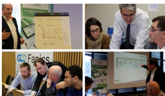
En présence des collaborateurs des Direcctes. Ci-dessus une équipe de la Direccte Ile-de-France