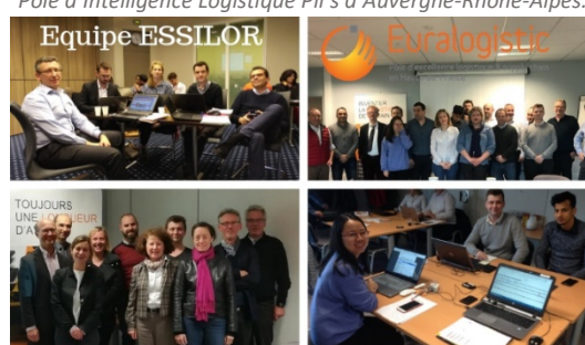
Avec la participation également des collaborateurs du pôle d’excellence régionale des Hauts de France Euralogistic.