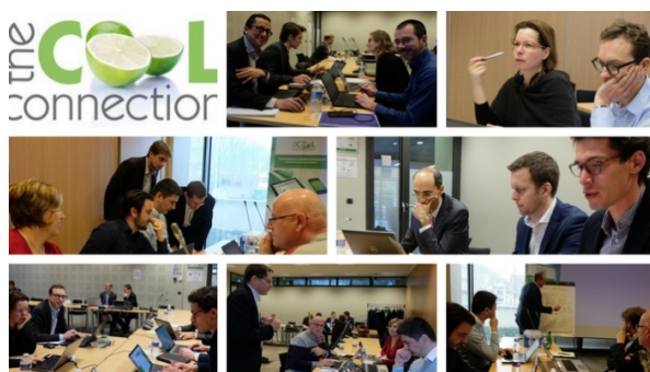
The Cool Connection le serious game Supply Chain et Finance Joué à la Direction générale des entreprises à Paris

Les précédentes journées découvertes qui se sont déjà tenues à Paris, Lyon et Lille ont déjà mobilisé plus qu’une centaine de salarié-es d’entreprises et d’institutions : MICHELIN, ESSILOR, AIR LIQUIDE, SANOFI, LEROY MERLIN, mais aussi des ETI comme CLASQUIN, TOURPAGEL, CHANTELE ou des écoles comme l’Université d’Artois, l’Ecole des Mines de Saint-Etienne, l’ECAM Lyon ou des cabinets de conseil ainsi que des employés et fonctionnaires des Direcctes ou des CCI chargés de conseiller les entreprises sur leur développement. Grâce à l’expérience et aux acquis des précédentes étapes et au soutien de poids du Cluster Bretagne Supply Chain et de l’Ecole d’ingénieur-es l’ECAM Rennes, la mobilisation en Bretagne sera renforcée.